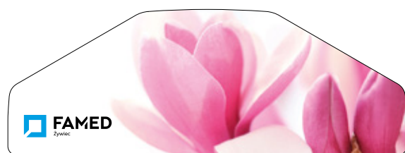
Стандартная расцветка – Magnolia Flower